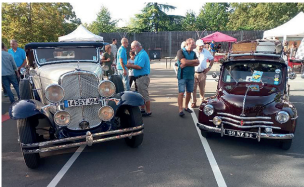
Text und Bild: Urban Mayer, Ehrenvorsitzende des Fördervereins Städtepartnerschaft

Eine weitere Bereicherung der Wiederholung des Events - vorgesehen in 2025 - durch vielleicht mehrere Teilnehmer oder Animationsbeiträge auf städtepartnerschaftlicher Ebene steht allen offen.