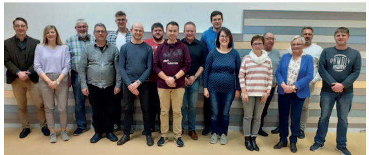
Die Mitglieder des Musikvereins Stetten-Hörschwag e. V. mit Herrn Bürgermeister Licht

Wir freuen uns schon sehr auf dieses Fest, bei dem auch gleichzeitig das 200-jährige Bestehen des Vereins gefeiert wird und auf zünftige Blasmusik!