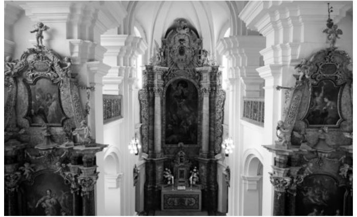
Innensicht der Mariaberger Klosterkirche.

Neben prächtigen Barock-Altären sind in der Mariaberger Klosterkirche wertvolle Skulpturen zu sehen, darunter eine Pietà aus dem 14. Jahrhundert. Durch eine sensible Renovierung blieb der authentische Charakter des Innenraums erhalten.